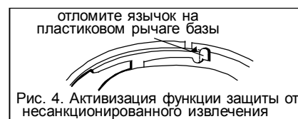
Рис. 4. Активизация функции защиты от несанкционированного извлечения