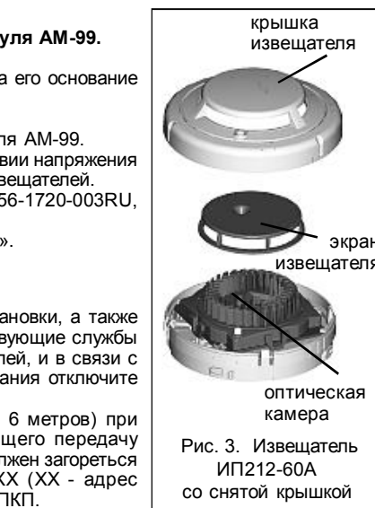
Рис. 3. Извещатель ИП212-60А со снятой крышкой

При необходимости защиты извещателя от несанкционированного извлечения или для обеспечения надежного крепления при наличии вибрации перед установкой базы произведите операции в соответствии с указаниями на рис. 4. Для снятия извещателя после активизации функции защиты отверткой с узким плоским шлицем отожмите пластиковый рычаг к центру базы через прямоугольное отверстие между базой и извещателем.